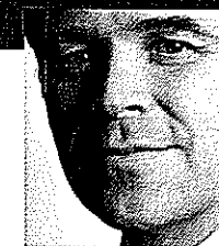
Aram van Bunge Ten Holter Advocaten

Voorwaarden moeten uitdrukkelijk worden overeengekomen